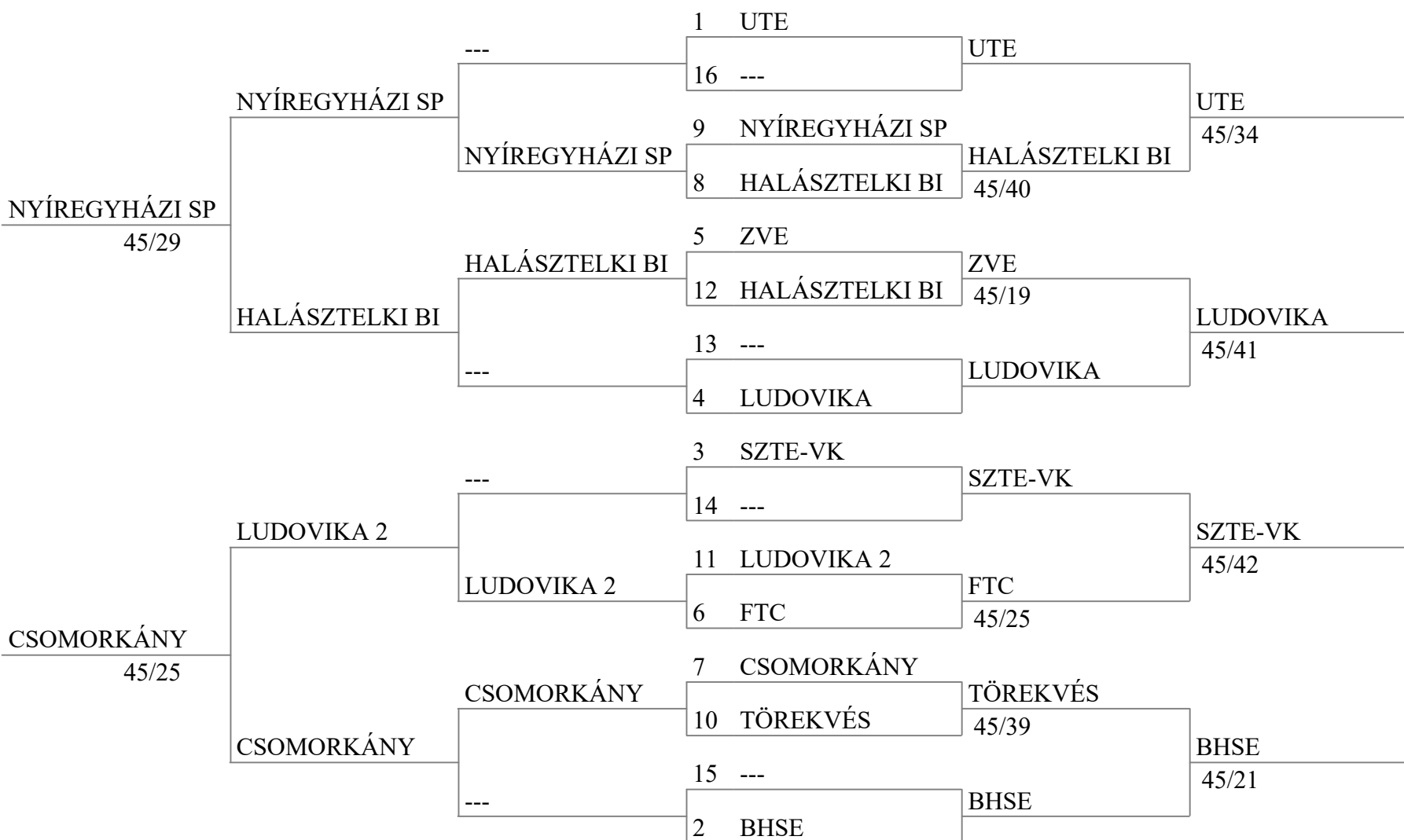
Tableau of 8