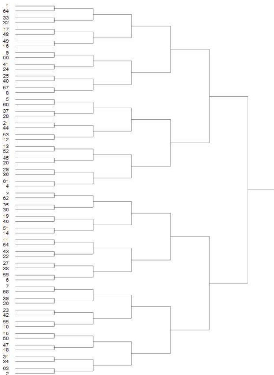
Figure 7a. Bout plan for individual direct elimination (table for 64 fencers)

„A” melléklet: Az egyéni versenyek 64-es táblája